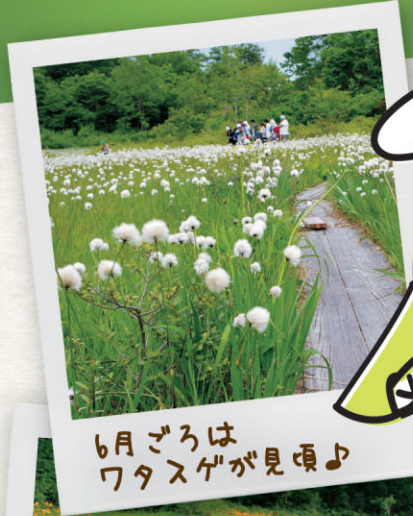
6月ごろは ワタスゲが見頃♪

災害土砂崩れにて入れなくなった国指定天然記念物の湿原「駒止湿原」。2017年から、従来の入り口の反対側の「南郷口」から期間限定にて、ガイド付のプレミアムシャトルバスを運行!6月2日(土)から10月28日(日)までの土・日・祝日のみツアーとして、駒止湿原ハイクをお楽しみ頂けます。