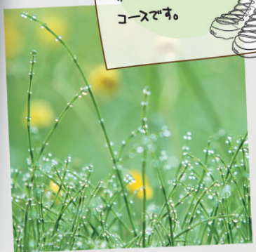
ミニ尾瀬とも呼ばれています。